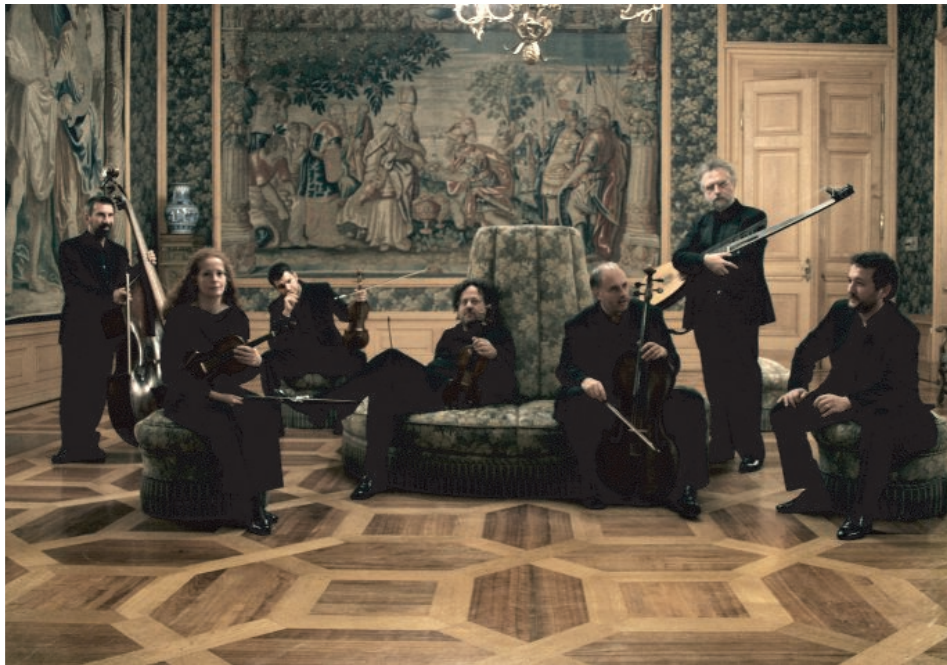
Sonatori de la Gioiosa Marca