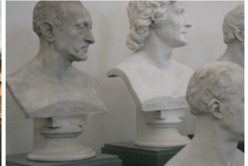
Residenzschloss Bad Arolsen, Schlossgarten, Steinerner Saal, Büsten im C.D. Rauch-Museum