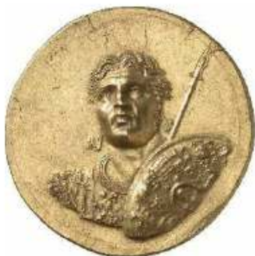
Um sie geht es: Goldmedaillon mit Bildnis Alexanders des Großen, eines der 540.000 Sammlungsobjekte!

Selbst wäre ich nicht auf die Idee gekommen, aber nachdem wir in den letzten drei Jahren schon Münzpatenschaften anlässlich von Geburt, Taufe, Geburtstag, Kommunion/Konfirmation und dem Freundesgedenken zuteilen durften, haben wir kürzlich auch die ersten Münzpatenschaften zum Muttertag vergeben. Die Münzpaten haben in der Anfangsphase die Anschubfinanzierung für den Interaktiven Katalog geleistet und eröffnen uns in schwierigen Zeiten die nötigen Handlungsspielräume. Wir betrachten die