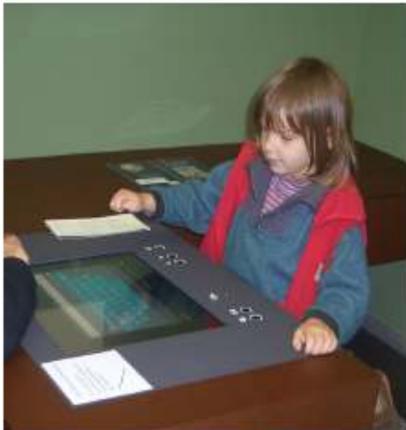
... für die nächste Generation